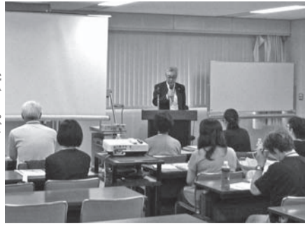
泉常務理事より開講の挨拶

8月31日(土)から、令和元年 度要約筆記養成講座が開講し ました。今年度は8月から12月 までの全14回で全84時間の講座 を実施することになり、全道各 地から手書き3名、パソコン6 名の受講申し込みがありました。