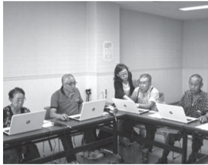
楽しみながら操作を習得

8月20日(火)〜22日(木)、美 唄市総合福祉センター「ぼぶら」 にて開催され、3日間で述べ21 名の参加がありました。