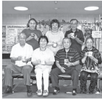
滝川教室参加者の皆さん

自分で選んだイラストや写真 を用いて、白地のマグカップ(昇 華コーティング済)に自分の好 きな絵柄や文字を貼付けます。 そこから熱処理(定着)して日 常生活で使える宇宙で自分だけ のデザインのマグカップを作成 しています。