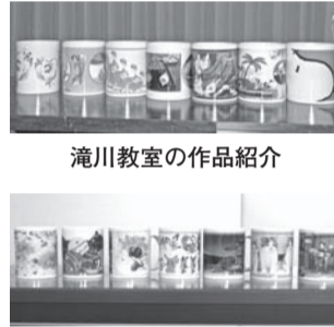
滝川教室の作品紹介

開催地の滝川身体障害者福祉 協会を始め、近隣地区の身体障 害者福祉協会の皆様のご高配と ご協力に感謝申し上げます。