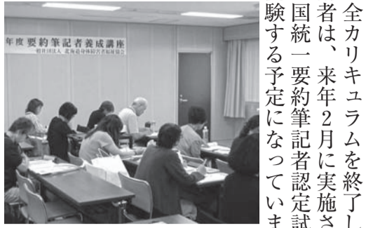
9名が受講した全体講義

全カリキュラムを終了した受 講者は、来年2月に実施される 全国統一要約筆記認定試験を 受験する予定になっています。