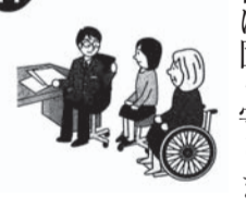
弁護士による相談

◆主な相談(相談料は無料です) ・法律に関する相談 例えば、身体・生命に関する相談、財産に対する侵害、相続関係、金融消費・契約関係、雇用・勤務条件関係等 ・人権擁護に関する相談 例えば、職場・施設・隣人・知人・家族・親族との人権に関するトラブル ・その他必要な相談 受付・お問合せは 電話 011(252)1233 FAX 011(252)1235