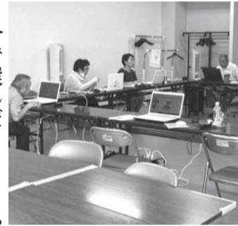
画像を貼り付けて配置などを調整します。

8月6日(火)〜8日(木)、滝 川市身体障害者福祉センターに て開催され、3日間で述べ21名 の参加がありました。