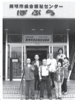
美唄教室参加者の皆さん

Excelデータに画像を貼 り付ける手順を確認し、好みの 枠やイラストを選びました。定 期的に開催されているパソコン 教室で操作に慣れている参加者 もいて、お互いの作品を見なが ら貼り付け方を工夫したり、調 整方法を教え合っていました。