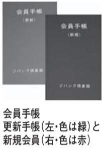
会員手帳更新手帳(左・色は緑)と新規会員(右・色は赤)