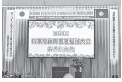
第68回日本身体障害者福祉大会あきた大会ステージ上部