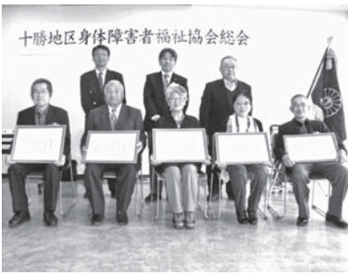
三役とともに記念写真におさまる受賞者の皆様

会長表彰授賞式では、自立更生者1名、更生援護功労者6名、合わせて7名が受賞し記念品が贈られました。