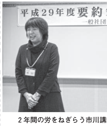
2年間の労をねぎらう市川講師

12月20日仙台市と姉妹都市である光州広域市の障がい者福祉関係と議事事務局関係の行政職5名が北海道庁での表敬訪問の後で当協会を訪問されました。