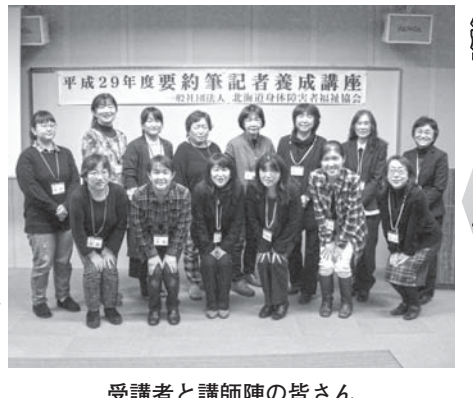
受講者と講師陣の皆さん

平成29年12月9日、今年度最後の6時間の講義を終えて昨年から全84時間のカリキュラムのすべてを修了しました。