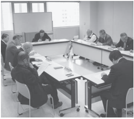
第4回理事会のようす

平成27年3月5日(木)、道民活動センタービル7階750研修室において、平成27年度予算を決める理事会が開催されました。