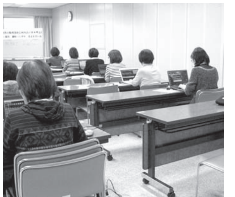
パソコン実技試験のようす

明日の障がい者福祉施策を担う若い世代の発掘に繋がるよう、北身協と加盟団体の活動が今後行われ、約2時間にわたる理事会は終了しました。