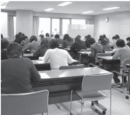
筆記試験のようす

平成27年2月22日(日)、道民活動センタービルにおいて、2014年度全国統一要約筆記者認定試験が実施されました。平成25年度または26年度の補習講習を受講した要約筆記奉仕員のうち、41名が受験しました。