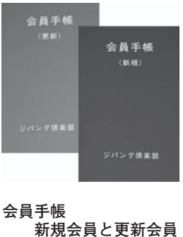
会員手帳 新規会員と更新会員

新規会員 【初回】3回目→2割引 【4回目】20回目→3割引 更新会員 【初回から3割引】