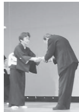
寄付金贈呈の一コマ