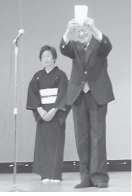
寄付金を頭上に赤坂会長