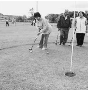
会員同士で交流中

同支部は昭和三十八年八月に身体障害者福祉協会胆振支部の厚真分会として発足。その後、組織の発展に伴い現在の厚真支部として活動が行われています。昭和二十五年に身体障害者福祉法が施行されたものの、障害者を取り巻く諸般の情勢は厳しく、厚真町を含む農村地域においても、厳しい時代でありました。そのような中、障害者が地域で安心して暮らせるよう歴代の会長をはじめ会員はたゆまぬ努力