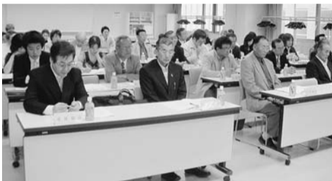
出席された加盟団体の皆さん

【事務局】要望します。 ⑤ 要約筆記事業は地元身障協会と連携して欲しい。(旭川市協会)