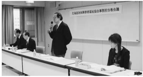
赤坂会長のあいさつ

を受けたという大変なニュースが世界を駆け巡っています。日本もこの影響を受けて大きな不況となるのが心配です。また、弱者といわれる障害者にとつて、厳しい状況がこれから続いても心配していただきます。私たちが身障協会はこうした状況下において、何としても各協会がレベルアップをして一生懸命に取り組んでいかなければならないと考えております。今日は、これまで以上に障害者福祉が行き渡るようになるのか、皆様の現場の意見を積極的に出して、聞かせていただきたい。」と挨拶した。