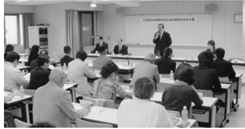
会長あいさつを熱心に聞く皆さん

を受けたという大変なニュースが世界を駆け巡っています。日本もこの影響を受けて大きな不況となるのが心配です。また、弱者といわれる障害者にとつて、厳しい状況がこれから続いても心配していただきます。私たちが身障協会はこうした状況下において、何としても各協会がレベルアップをして一生懸命に取り組んでいかなければならないと考えております。今日は、これまで以上に障害者福祉が行き渡るようになるのか、皆様の現場の意見を積極的に出して、聞かせていただきたい。」と挨拶した。