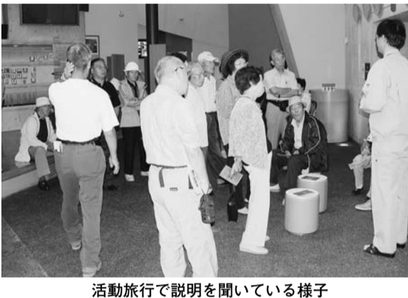
活動旅行で説明を聞いている様子

同協会は、身体障害者が積極的に社会参加する機会を設け、地域において心身ともに健やかに過ごすことができるよう、相互に連携・協調することを目的として活動しており、老人クラブ連合会共催のスポーツ大会や会員の親睦と交流を深めるための活動旅行等を実施しています。また、行事活動のマンネリ