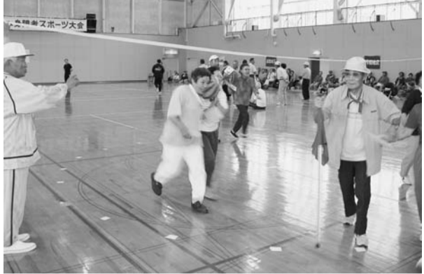
合同実施したスポーツ大会の一場面

一泊二日で会員相互の親睦交流等を目的に実施 ▼九月 檜山支庁地区身体障害者福祉協会会員研修会 ▼一月 交流事業(年の初めに会員の親睦交流等を目的に実施)