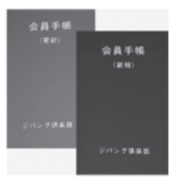
会員手帳 更新手帳(左・色は緑)と新規会員(右・色は赤)

お電話の際は、お手元にジパング手帳と障害者手帳をご用意下さい。 【申し込み・問い合わせ】 地区の身体障害者福祉協会か、左記へ 〒060-0002 札幌市中央区北2条西7丁目 道民活動センタービル4階 一般社団法人 北海道身体障害者福祉協会 電話 011(251) 1551