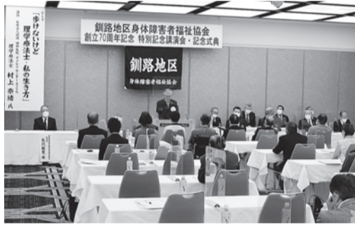
たくさんの方に出席していただきました。

令和4年10月30日(日)、釧路プリンスホテル(釧路市)において、釧路地区身体障害者福祉協会の創立70周年記念式典が開催されました。