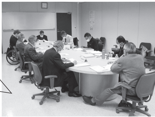
今年度最後の理事会でした。