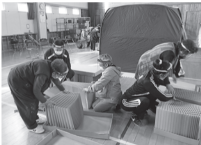
避難ベッドで、疑似体験。

正午から「お久しぶりですねの集い」を行い、昼食(黙食)の後、麻雀・将棋・輪投げ・ミニボウリング・卓球などを楽しみました。コロナ禍のため令和2年2月以降のレクリエーションとなり、「人」と会うことがなかなかできない状況が続いていますが、「久しぶりに会うことができ、元気な姿が見られてよかった。」と多くの皆さんから感想をいただきました。