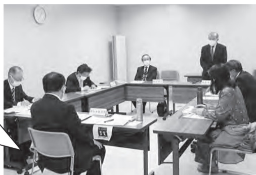
初めてお会いする方もいて自己紹介から始まりました。

課題となっておりました北身協正会員の会費については、令和3年度の定時総会及び事務局長・事務担当者会議の中で、加盟団体の事務局長の代表者による