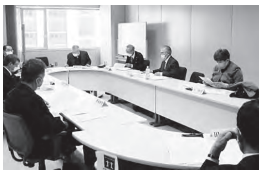
→ 令和3年度最後の理事会

右記の議案について、審議が行われ、議案どおり議決されました。また、4項目について事務局から報告がありました。事業計画の中から会議等の主なものとして、6月15日(水)「北身協定時総会」、7月6日(水)「事務局長・事務担当者会議」を開催する予定です。