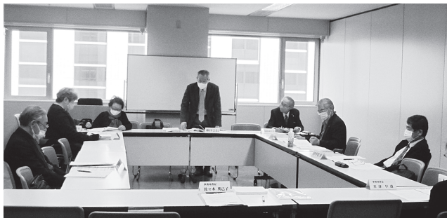
「第7回理事会」の様子

各議案について、審議の結果、理事・監事の方々から様々な意見等をいただき、全員一致で承認、決定事項となりました。