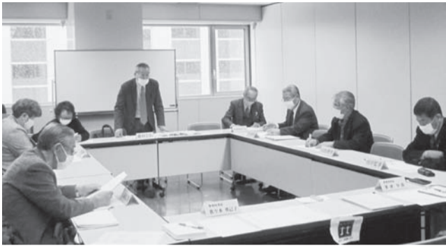
「第6回 理事会」の様子

各議案について、審議の結果、理事・監事の方々から様々な意見等をいただき、全員一致で承認、決定事項となりました。