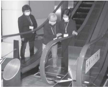
実際にエスカレーターを 使った介助の実習場面

エスカレーターの乗り降りだ けでなく、乗る前の通訳介助や、 乗っている時の介助員の立ち位 置や行動についても、実技を通 して学ぶことができました。