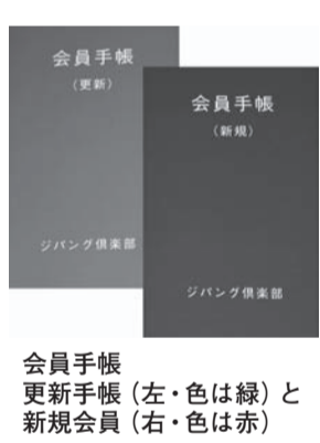
会員手帳 更新手帳（左・色は緑）と 新規会員（右・色は赤）