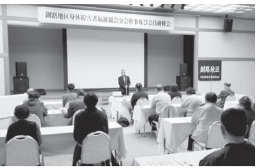
感染症予防について学んだ研修会

また、日本赤十字社は、ウイ ルス感染より恐ろしいものとし て、不安や恐怖からくる非難や 差別や中傷を挙げ、「正しく知 り、正しく恐れ」ことが大切 であると、呼び掛けました。