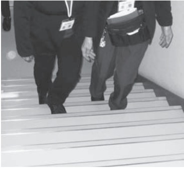
階段の昇降についての再確認場面

一日目は屋内での移動介助基本技術の再確認と通訳基本技術の再確認(場面別応用通訳・介助技術として屋外での歩行演習)等がありました。