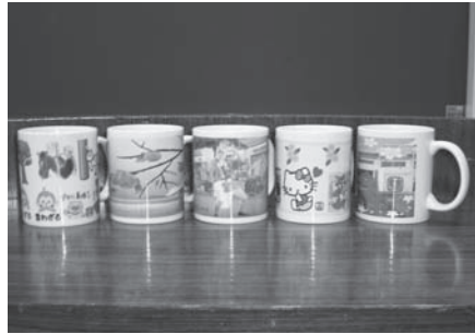
今は亡き母との思いが詰まった作品や季節感たっぷりの作品もありました。

どこの教室でも共通の話題となっていました。会員の皆さんが複数参加される行事は今年度はこれが初めてで、それぞれが「お元気が良かったか?」が最初の挨拶で旧交を深めておりました。帯広教室ではアイデア豊かに個性豊かな作品が多かったです。