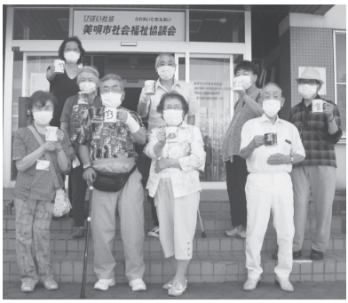
来年も皆さん揃って参加してください。

「先生、来年は、どのようなものを考えていますか」と質問がありましたが、「それは秘密です」とだけしか、答えられませんでした。 昨年より参加された方は、「今年が来るのが待ち遠しかったよ、昨年とは一味違った作品になったでしょ」と、ニコニコ微笑んでいました。