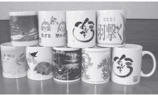
力作が揃いました。「市民文化祭があったらなあ」と皆さんが言っていました。

「先生、来年は、どのようなものを考えていますか」と質問がありましたが、「それは秘密です」とだけしか、答えられませんでした。 昨年より参加された方は、「今年が来るのが待ち遠しかったよ、昨年とは一味違った作品になったでしょ」と、ニコニコ微笑んでいました。