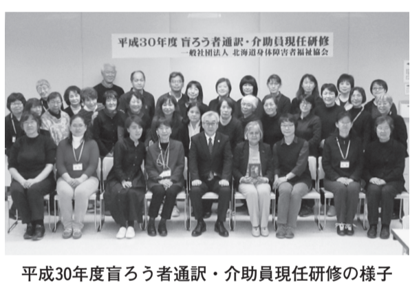
平成30年度盲ろう者通訳・介助員現任研修の様子