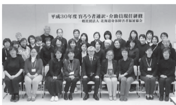
平成30年度盲ろう者通訳・介助員現任研修

北海道身体障害者福祉協会 電話 011(251) 9302 FAX 011(251) 0858 ※まだ、定員に余裕があります。