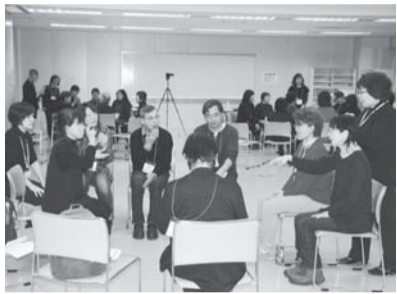
平成30年度現任研修の様子

◆定員 40名程度 ◆受講料 無料 ※食事実習の昼食代等は自己負担になります。 ◆申し込み 8月21日(金) 締切 ※カリキュラムや申し込み方法等の詳細については、5月15日に当協会のホームページに掲載済みです。 【申し込み・お問い合わせ】 〒060-0002 札幌市中央区北2条西7丁目 道民活動センタービル4階 北海道社会参加推進センター (一般社団法人 北海道身体障害者福祉協会) 電話 011(251) 9302 FAX 011(251) 0858