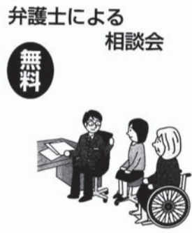
弁護士による相談会

主な相談(相談料は無料です。) ▼法律に関する相談 例えば、身体・生命に関する相談、財産に対する侵害、相続関係、金融消費・契約関係、雇用・勤務条件関係等 ▼人権擁護に関する相談 例えば、職場・施設・隣人・知人・家族・親族との人権に関するトラブル ▼その他必要な相談 【受付・お問い合わせ】 電話 011(252) 1233 FAX 011(252) 1235