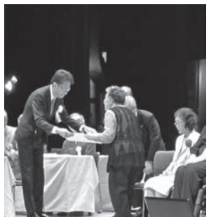
北海道善行賞の受賞

○式典・表彰 表彰は、北海道善行賞(知事表彰)の自立活動者4名、北海道身体障害者福祉協会会長表彰の自立更生者19名、援護功労者10名に、表彰状と記念品が贈られました。