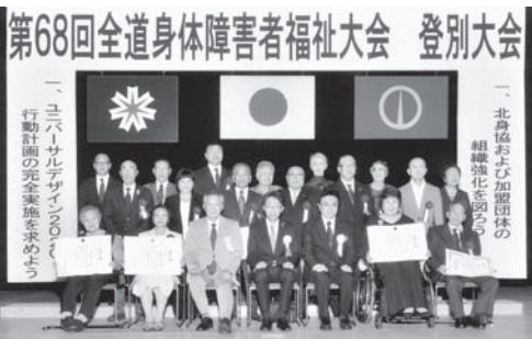
受賞者のみなさま