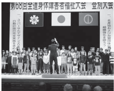
合唱「私たちの道」 登別市立幌別西小学校6年生の皆さん