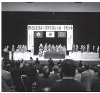
登別大会開会式・国歌斉唱

北海道身体障害者福祉協会・登別市・登別市社会福祉協議会共催の「第68回全道身体障害者福祉大会・登別大会」が10月6日(日)に開催されました。 秋晴れの好天に恵まれた当日は、道内各地からボランティアを含め500余名が集い、大会実行委員会および地元協力の支えられ、盛大な大会となりました。