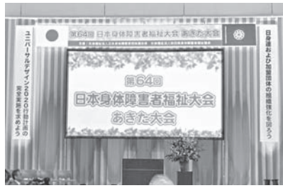
第68回日本身体障害者福祉大会あきた大会ステージ上部