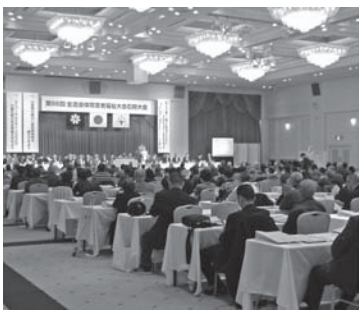
一昨年の石狩大会の様子