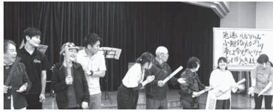
「ブームワッカー」の演奏

校内を見学する際は、学生と一緒にゆつくりと歩き、優しい配慮に参加者の顔もほころび、広い学内を楽しく見学できました。 見学後、講堂にて学生たちがトーンチャイム(ハンドベルの一種)の演奏を披露してくれました。また、手話を取り入れた演奏やブームワッカー(調律されたカラフルなプラスチックチューブを叩いて音を出すことができる楽器)を一緒に演奏し、笑顔あふれる研修となりました。