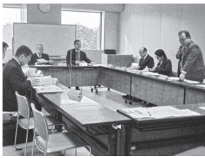
活発な意見交換が行われました。

2月21日(水)道民活動センターホールにおいて、平成29年度障害者社会参加推進協議会総会が開催されました。この協議会には、身体障害者部会・精神障害者部会・知的障害者部会の3部会が設置されており、各団体や行政機関の代表者によって構成されています。