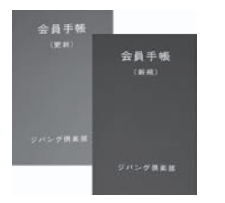
会員手帳(左・色は緑)と更新手帳(右・色は赤)と新規会員

▼入会資格 身体障害者手帳をお持ちの方 男性60歳・女性55歳以上の方 ▼年会費 一人 1,350円 (入会金はありません)