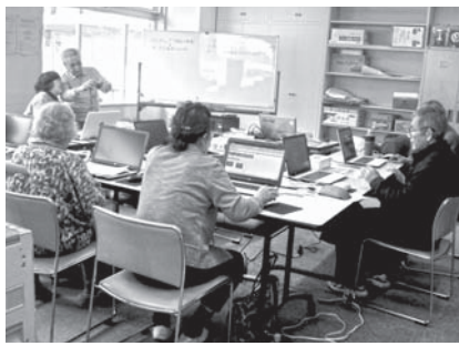
昨年は「ティッシュボックス作り」 今年のテーマは・・・お楽しみに！

パソコンの基礎から、ワード・エクセルを使用した文書や表・葉書など、オリジナル作品を作ってみませんか。パソコンをお持ちでない方も参加できます。