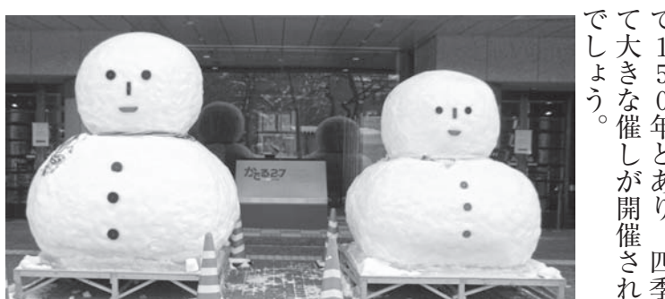
北の風物詩「雪だるま」毎年、雪まつりの期間に事務所の玄関前に鎮座しています。

特に今年は北海道と命名されて150年とあり、四季を通じて大きな催しが開催されることでしょう。