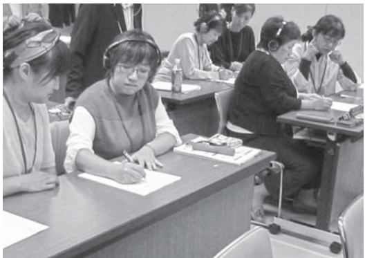
10・11月の要約筆記者養成講座の様子

この講座は、北海道からの委託を受け、手話の理解と取得の困難な中途失聴者・難聴者のコミュニケーション手段としての要約筆記技術等の取得を促すためのもので、厚生労働省が定める84時間以上のカリキュラムに基づき、平成29年度は、昨年度の前期講座42時間修了者を対象に、後期42時間の養成講座を、9月9日(土)より12月9日(土)までの7日間で実施します。