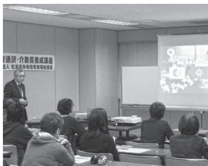
11月19日午前の講義です、総合支援法の77条と78条の解説が主題でした

この講座は、平成25年度に厚生労働省が定めた84時間の養成カリキュラムのうち、必修科目42時間の講義を、北海道・札幌市・函館市・旭川市からの委託事業として、講師に札幌盲ろう者福祉協会のご協力をいただき、9月23日(土)より11月19日までの7日間で開催しました。