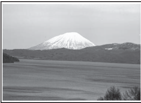
「羊蹄の残雪」 撮影日 H29年8月3日