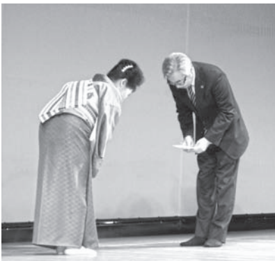
寄付贈呈式の様子

会場では寒空の中を大勢の観客の方々や泉流北海道の方々、関係各社・団体より心温まるご浄財を頂戴してまいりました。が「身体障がい者福祉の調査・研究・開発と理念の追求に一円たりとも無駄にせず大事に使わせていただきます」とお礼を述べさせていただきました。