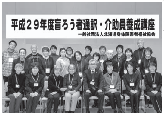
平成29年11月19日閉講式

11月は11月18日(土)、19日(日)の計2日間12時間で座学や実習がありました。11月の講座では座学で通訳・介助員の心構えと倫理やその業務の内容を学び屋外での移動介助の実習も行いました。最後に全ての受講者へ、各人の受講時間を証明した受講証明書を手渡しましたが、受講日に欠席して42時間に満たない受講者は平成30年1月末日までに救済処置としてビデオによる補講を行っていただき、既定の42時間に至ったときに改めて受講証明書を発行します。