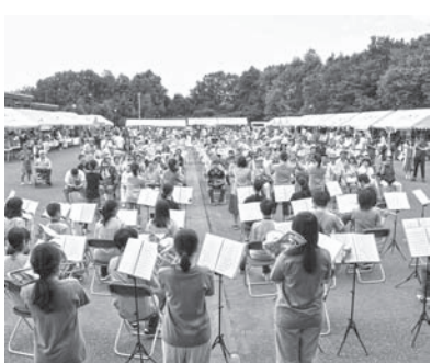
様々な催しが披露された会場内

会場には利用者・職員による売店や授産製品の特売コーナーなどが数多く並び、ステージイベントでは、地元中学校の吹奏楽部や地元で活躍しているアーティスト、歌手、バンドによる演奏のほか、よさこいの演舞などが披露され、会場は終始笑顔と感動に包まれました。