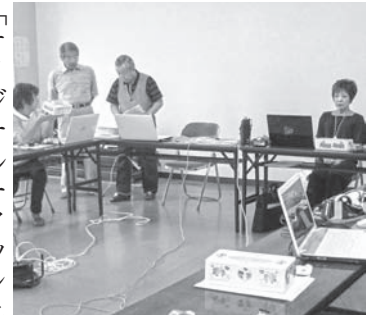
相談しながらデザイン決定

8月8日(火)〜10日(木)の三日間、滝川市身体障害者福祉センターにて、障がい者向けパソコン教室を開催し、三日間で延べ21名の参加がありました。