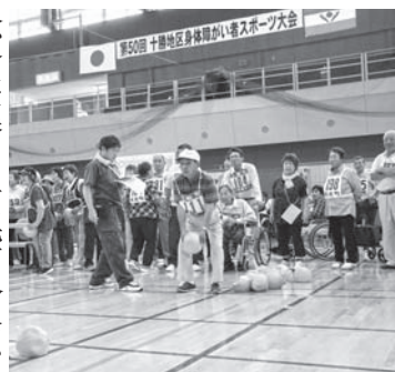
リベンジ！今年は乗せるぞ!!

大会競技は個人、町村・プロック対抗の7種目で、管内14町村から約244名の選手により熱戦が繰り広げられました。