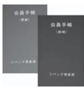
会員手帳(左・色は緑)と更新手帳(右・色は赤)

新規会員 【初回】3回目↓2割引 【4回目】20回目↓3割引 更新会員 【初回から3割引】