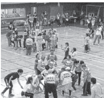
大人の本気！白熱の玉入れ！

総合優勝は士幌町分会、準優勝は2町がまさかの同点となり、最終はジャンケンで勝敗を決しました。準優勝は浦幌町分会、三位は大樹町分会となりました。