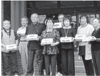
滝川会場 参加者の皆さん

「オリジナルティッシュボックスケース」の作成では、数多くあるイラスト見本の中からお気に入りを見つけたり配置を考へたりする際に、他の参加者や施設の方に相談したり、逆にアドバイスしたりと、周りの方とコミュニケーションをとりながら作業を進める姿が印象的でした。出来上がった作品は9月末の「ふれあいの集い 2017」に出品されます。