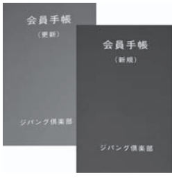
会員手帳 更新手帳(左・色は緑)と 新規会員(右・色は赤)

◆入会資格 身体障害者手帳をお持ちの男性60歳・女性55歳以上の方は、年会費 一人 1,350円 (入会金はありません)