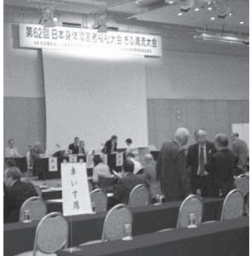
評議員会会場の様子