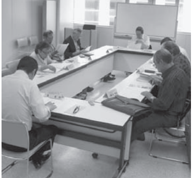
第1回推進委員会は2時間以上わたった

7月5日(火)道民活動センタービルにおいて、8名の大会推進委員の参加のもと開催されました。