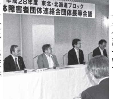
KKRホテル札幌において行われた会議の様子

(2) 平成28年度東北・北海道ブロック身体障害者団体連絡会に係る事業計画及び収支予算について