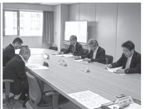
奨学生の選考について慎重な審議がされた

最初に、平成27年度道新コスモス奨学金決算報告について事務局より説明があり、続いて平成28年度予算案、及び奨学生の選考について慎重に審議され、今年度の奨学生が決定しました。