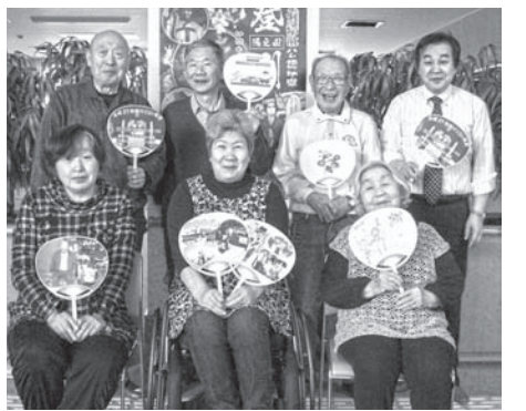
登別教室 受講者のみなさん

また、作成したうちわは、平成27年12月5、6日に登別市富士町の市民会館で開催された第11回障害者週間記念事業の作品展に出品されました。