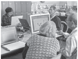
他に、カレンダー作り等を行い、受講者からはWordの書式設定や、パワーポイントの操作について質問がありました。

11月17日(火)～19日(木)の3日間、登別市総合福祉センター「しんた21」において、パソコン教室を開催しました。3日間で15名が参加。オリジナルうちわ作りでは、ご自身が描いた水彩画をスキャナで取り込み作成する方や、複数の思い出の写真で一枚のうちわを作成する受講者もいらっしゃいました。