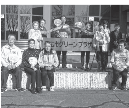
登別教室 受講者のみなさん