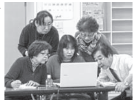
帯広教室 受講者のみなさん

●帯広教室 11月10日(火)～12日(木)の3日間、帯広市グリーンプラザにおいてパソコン教室を開催しました。 3日間で28名が参加した帯広教室では、オリジナルうちわ作