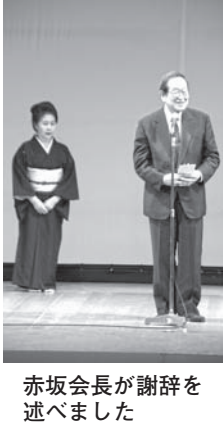
赤坂会長が謝辞を述べました

第2部でも16演目が披露され、予定を無事に終了しました。寄付金は北海道の身体障害者福祉へ使わせていただきます。ありがとうございました。