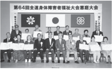
北海道善行賞、北海道身体障害者福祉協会会長表彰の受賞者みなさん

表彰は、北海道善行賞(知事表彰)の自立活動者4名、自立支援功労者の4名、北海道身体障害者福祉協会会長表彰の自立更生者19名、援護功労者12名に、表