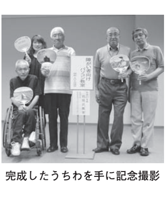
完成したうちわを手に記念撮影

障がい者一〇番 道内全域の障がい者及び家族などからの悩み(法的手続き、人権等に関する相談)に対し、弁護士による無料法律相談を行っています。 電話 011(252) 1233 FAX 011(252) 1235 弁護士相談 第4週の火曜日(要予約) ※札幌市内の方は「札幌あんしん相談」電話(633) 1313の利用をお願いします。