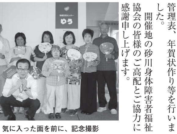
気に入った面を前に、記念撮影

3日間で21名が参加した今回の教室では、オリジナルうちわ作りをはじめ、パーソナル新聞、病歴管理表、年賀状作り等を行いました。開催地の砂川身体障害者福祉協会の皆様のご高配とご協力に感謝申し上げます。