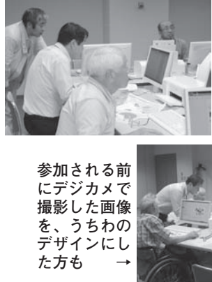
←ネットのつながりを楽しみました

3日間で12名が参加し、オリジナルうちわ作り、年賀状作り、エクセルを使ってカレンダーの作成等を行いました。