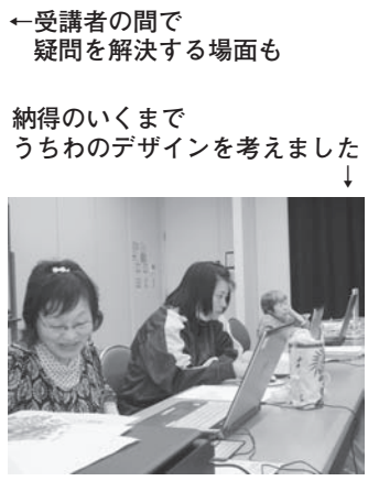
←受講者の間で疑問を解決する場面も

9月8日(火)から10日(木)までの3日間、砂川市地域交流センター「ゆう」においてパソコン教室を開催しました。