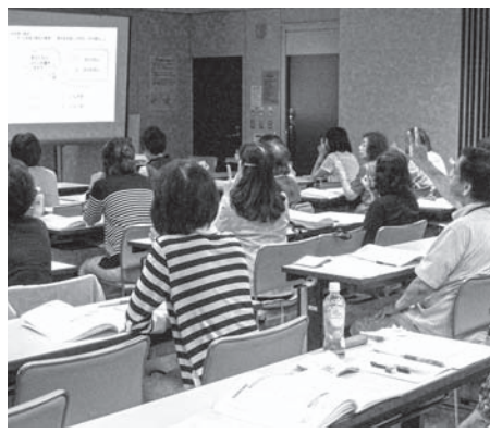
22日1講目 参加型講義のようす

受講者参加型の講義もあり、来年2月の認定試験の合格に向けて熱意のこもる講義をしていただきました。その後1時間の休憩時間には、昼食の後、受講者全員で簡単な自己紹介をしました。