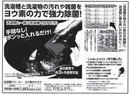
リピーター続出! 「洗濯槽クリーナー ヨウ素のチカラ」

北海道身体障害者福祉協会では、独自の財源確保の一環としてインターネットで収益事業を立ち上げております。 収益金は身体障害者の福祉向上を目指す活動に有効に活用させていただきます。