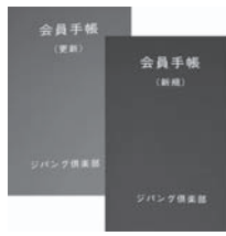
会員手帳 更新会員(左・色は緑)と 新規会員(右・色は赤)

▼ジパング手帳のお届けは、お申込から2〜3週間程度の時間が必要となりますので、予めご了承ください。 尚、更新手続きは1ヶ月前から可能です。 期限を過ぎますと、割引率が新規会員扱いになりますので、お早めに更新手続きをお願いいたします。