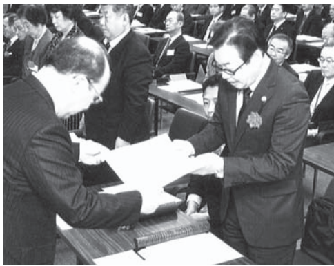
感謝状授与のようす

4月6日(月)、北海道新聞本社7階特別会議室において、公益財団法人北海道新聞社会福祉振興基金 創立50周年記念式典が開催され、その中で、当協会が感謝状をいただきました。