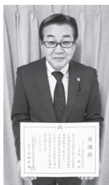
いただいた感謝状

これらの善意は、各種の助成事業、高校生などへの奨学金、社会福祉法人の設備整備への低利貸し付け事業に使われています。当協会では昭和56年より、基金の奨学金給付の申請受付から選考までの事務業務を行い、これまで1,450人を越える奨学生に給付することができました。