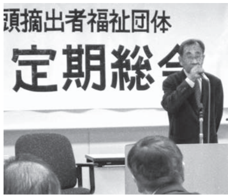
会長挨拶のようす

平成27年4月15日(水)、道民活動センタービルにおいて北海道咽頭摘出者福祉団体(北鈴会)の