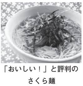
「おいしい!」と評判の さくら麺

詳細はインターネットで「北身協」と検索してください。ご希望の方には、カタログを送付いたします。