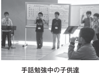
手話勉強中の子供達

「将来に期待出来る若者達!!」 平成26年3月8日、恵庭市、黄金ふれあいセンターで恵庭手話の会ジュニアプロジェクトが開催されました。障がいのある方もない方も、想像以上の老若男女が集まりました。子供たちの企画に感動して、明るい未来を感じる企画でした。恵庭手話の会の皆さま、ジュニアの皆さん、本当に有難う。