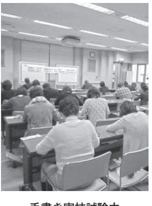
手書き実技試験中

今後の予定の説明があり、受験者全員は帰路となりました。 今後は3月10日頃合格者が判明、3月末合格書の発送予定となっております。