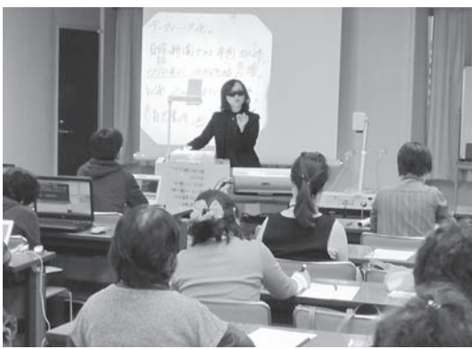
実技模擬試験 講評

全体を通じ、講師から注意点の話と来春実施予定の認定試験の話があり、八月から今回迄三ヶ月、六回の講義・実習が終了致しました。各受講生は自信と不安と安堵の入り交じった表情で帰路につきました。