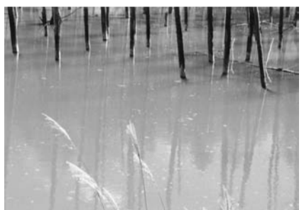
湧別町 田中 幸雄 題名「青い池」