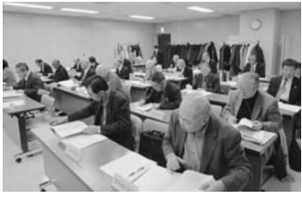
臨時総会の一コマ