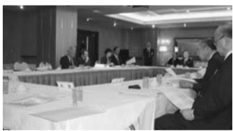
団体長会議の一場面

一、平成二十五年年度の全国大会は、北身協と札幌身協の合同による北海道での共同開催と決した。