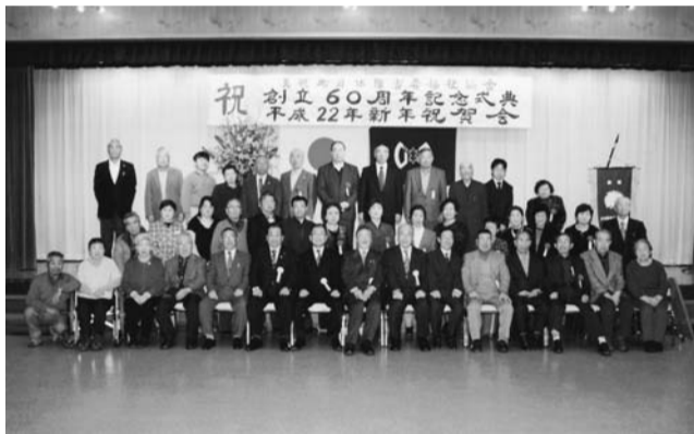
創立60周年記念式典

名、地区理事二十名のもと、元気で明るい運営活動を行なっています。この一年間の活動としては、道のスポーツ大会、網走支管内内スポーツレクリエーション大会の参加はもとより、全国スポーツ大会にも選手を輩出しています。この他年間行事計画として、春の日帰り研修旅行、親睦ゲーム大会、美幌町三者障がい者福祉団体親睦交流会、社協主催の「ふれあい広場」の参加、秋の一泊研修旅行、視覚障がい者の集い、重度障がい者家