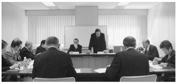
理事会に出席された理事・監事の皆さん

道障がい者及び障がい児の権利擁護並びに障がい者及び障がい児が暮らしやすい地域づくりの推進に関する条例を昨年三月に制定し、これまで、障がいのある方やその家族の方々など、幅広い道民の皆さまからいただいたご意見を踏まえながら、障がいのある方々への支援体制づくりと就業支援を推進するための「地域づくりガイドライン」や「就業支援推進計画」の策定や道内十四の圏域に権利擁護などについて協議する「地域づくり委員会」の設置準備など、本年四月一日の全面施行に向けた取組みを進めてまいりました。今後とも、この条例が目指しております。障がいのある方の権利擁護、暮らしやすい地域づくりの推進、働く障がい者の方々への応援などのために様々な施策を進めてまいりたいと考えておりますので、加盟団体の皆さまには、引き続き一層のご理解とご協力を賜りますようお願いいたします。